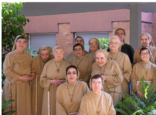
Fraternitat de Clarisses de Vilobí d'Onyar

La pregària de la Jornada d'enguany diu: «Concediu-los romandre fidels a la seva vocació, i feu madurar plenament el fruit de la seva consagració monàstica, perquè l'Església segueixi rebent d'ells l'abundància de la fe i la caritat». Que així sigui.