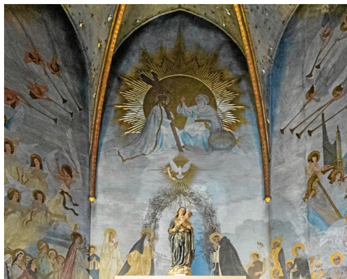
Imatge de la Santíssima Trinitat a la parròquia del Mercadal de Girona

No podem explicar que Déu és Trinitat només amb els mitjans de la pròpia raó. Ara bé, sí que podem reconèixer