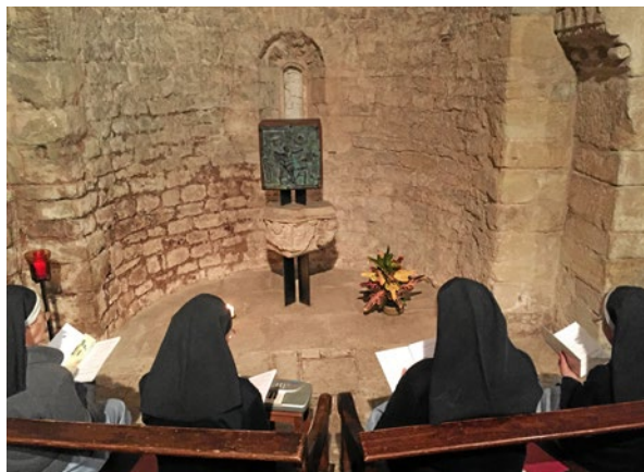
Vespres al monestir de Sant Daniel