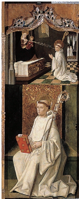
Part del retaule de la Mare de Déu de Canapost (Museu d'Art de Girona)

És difícil trobar altres representacions de Bernat de Claravall a la nostra Diòcesi, ja sigui en la toponímia o en la dedicació d'esglésies, ermites i parròquies. Però sí que ens ha deixat una presència i un testimoni de primer ordre les darreres dècades: la comunitat cistercenc de Solius, que enguany ha celebrat els cinquanta anys des de la seva fundació. Sense oblidar la presència històrica de les bernardes , a l'antic monestir de Sant Feliu de Cadins, prop de Cabanes, a l'Alt Empordà. Les monges cistercencques s'hi establiren ja el 1160. Al segle XV es traslladaren al Mercadal de Girona, i a mitjan segle XX, a Salt, i finalment a Sant Gregori fins el 2004. MC