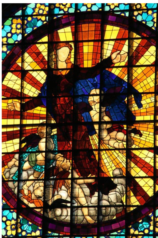
Imatge del vitrall de l'Assumpció de Maria a la Catedral de Girona

Ella és la primera salvada del tot per Crist. Recordem per