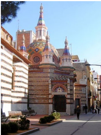
Sant Romà, a Lloret de Mar