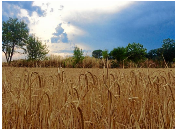
Camp del Baix Empordà

El gran problema de la mort i de moltes ferides que ja no es poden tancar; el fet de la pobresa i de la fam dels anomenats Tercer i Quart món; tot tipus de marginació; la mort dels innocents; la violència, les famílies trencades... Abans de parlar de les llavors que cal sembrar deixeu-me recordar que seguir Jesús és seguir un crucificat. I que