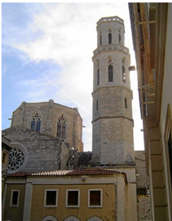
Sant Pere de Figueres