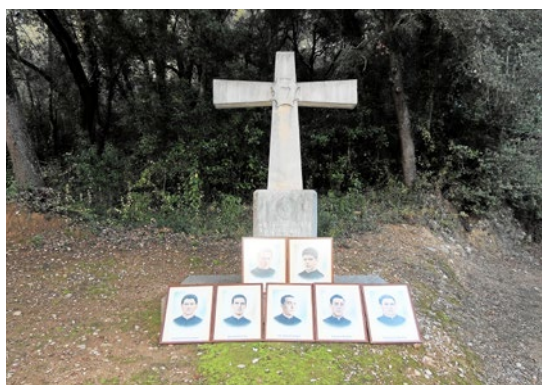
Creu al lloc on van ser morts els set religiosos

Comptarem amb la presència del cardenal Angelo Amato, del bisbe de Girona, de dos bisbes missioners del Sagrat Cor –un del Perú i l'altre de la República Dominicana–, del superior general, de superiors provincials d'Europa i fidels d'arreu de Catalunya, especialment de Girona, Canet de Mar i Serinyà, que ens volen acompanyar. Tot plegat ens omple de joia.