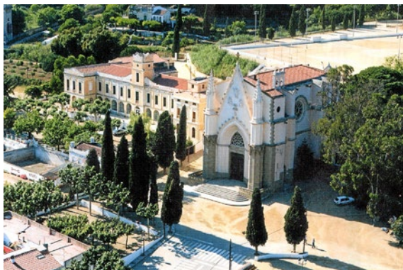
Antic seminari dels missioners del Sagrat Cor a Canet

La fundació és obra del sacerdot francès Jules Chevalier, a mitjan segle XIX, per ajudar l'acció missionera de l'Església. Es va iniciar precisament en les illes franceses del Pacífic. A principis del segle XX arriben a Catalunya aquests missioners, a causa de les limitacions imposades pel govern francès. Servim des de l'ensenyament, la sanitat i l'acció social; i actualment estem presents a la Diòcesi de Barcelona, al santuari del Sagrat Cor del carrer Rosselló, on també tenim un centre escolar des de fa 120 anys: el Col·legi Sant Miquel.