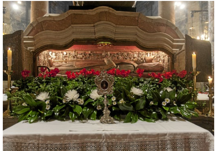
Sepulcre de sant Narcís de la capella de Sant Feliu de Girona

Desitjo subratllar el gran nombre de voluntaris que des de l'Església i com a Església ofereixen els seus serveis a tothom, fent realitat les obres de misericòrdia: catequistes, equips amb responsabilitats parroquials, voluntaris de Càritas, els qui serveixen els malalts i ancians a casa o als hospitals, les fundacions socials d'habitatges i de residències; les escoles cristianes, que cerquen la millor manera d'educar; els professors