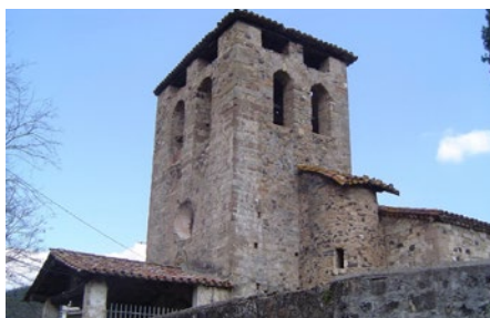
Parròquia de Santa Eulàlia de Begudà