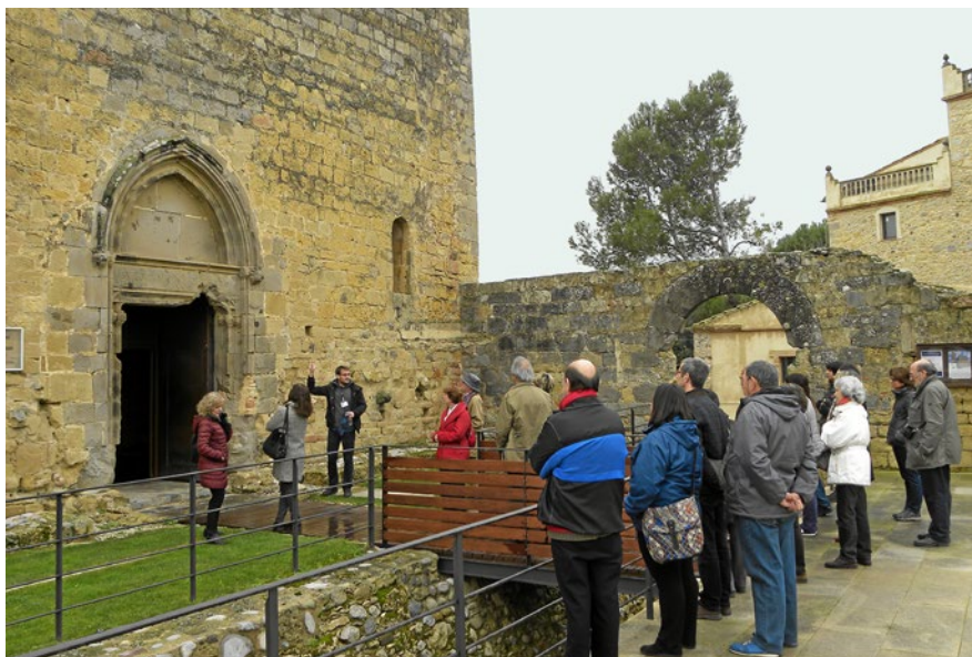
Itineraris guiats a la Diòcesi de Girona