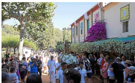
Processó amb motiu de la Festa de Santa Cristina de Lloret de Mar

Festa de Santa Cristina a Lloret de Mar. A les 8 del matí sortirà de l'església parroquial la processó amb la imatge de la santa fins a la platja on s'embarcarà i en processó marítima anirà fins a l'ermita de Santa Cristina. A les 10 se celebrarà la Missa. En finalitzar, esmorzar popular i retorn en processó marítima fins a Lloret.