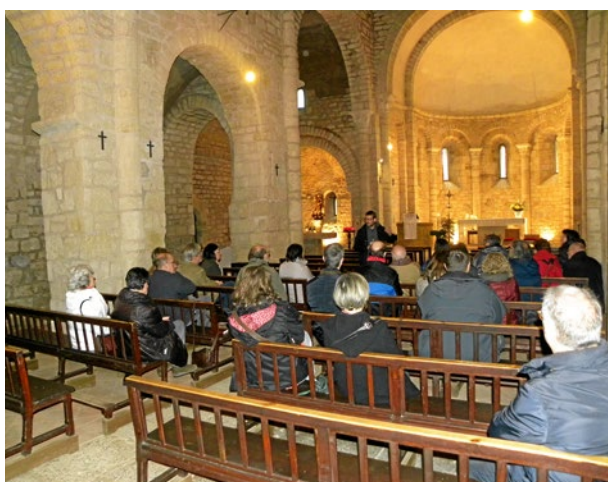
Itineraris guiats a la Diòcesi de Girona

Per a més informació de les activitats o per reservar plaça cal posar-se en contacte amb Catalonia Sacra a través de www.catalonia-sacra.cat o info@cataloniasacra.cat .