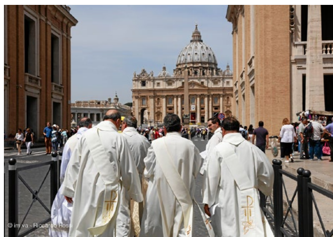
El maig de 2016 va tenir lloc a Roma el Jubileu dels diaques permanents, en el marc de l'Any Sant de la Misericòrdia

buir l'Eucaristia, assistir i beneir el matrimoni en nom de l'Església, portar el viàtic als moribunds, llegir la Sagrada Escriptura als fidels, instruir i exhortar el poble, presidir el culte i la pregària dels fidels, administrar els sacramentals, presidir el ritu dels funerals i de la sepultura (s'entén sense celebració de l'Eucaristia). Dedicats a les tasques de caritat i d'administració, que es recordin els diaques de la recomanació de sant Policarp: "Que siguin misericordiosos, diligents i caminin en la veritat del Senyor, que es va fer servidor de tots"».